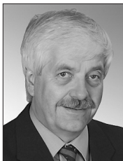
Präsident des Stiftungsrates Président du Conseil de fondation Presidente del Consiglio di fondazione

Der in diesem Masse nicht erwartete Ausbruch der Hypothekarkrise in den USA hat nicht nur die Finanzmärkte ins Schwanken