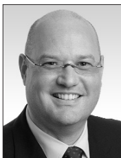
Geschäftsführer Le Directeur Il Direttore