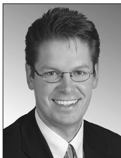
Präsident der Anlagekommission Président de la commission des placements Presidente della Commissione per gli investimenti

Auf dem investierten Vermögen konnten netto CHF 13.4 Mio. (Vorjahr 74.3 Mio.) erwirtschaftet werden. Im Berichtsjahr 2007 wurde eine Rendite von 1.05 % (Vorjahr 6.06 %) erzielt. Die Benchmark für 2007 beträgt 1.25 % (Vorjahr 5.06 %), womit unser Anlagevermögen 0.2 % unter dem vergleichbaren Markt abgeschnitten hat. In diesem ernüchternden Ergebnis widerspiegeln sich die Turbulenzen an den Börsen. Die enormen Abschreibungen der Banken, welche durch die Hypothekarkrise in den USA notwendig wurden, haben die Anleger sehr verunsichert. Die Märkte waren ausserordentlich starken Schwankungen nach unten wie nach oben ausgesetzt, mit eindeutiger negativer Richtung. Der US-Dollar, als eine der wichtigsten Währungen, hat historische Tiefen erlebt. Deutlich unter unseren Erwartungen lagen die Obligationen Schweiz mit einer Rendite von -1.06 %. Ebenfalls negativ haben die Immobilienfonds Schweiz abgeschlossen. Dies war jedoch aufgrund der allgemeinen Zins- und Aktienmarktsituation zu erwarten. Als Stabilisator haben sich in dieser schwierigen Zeit die Hedge Funds bewährt. Die Aktien Emerging Markets glänzten wiederum mit einem zweistelligen Zuwachs von rund 26 %. Weitere Informationen finden Sie auf den Seiten 20 und 21.